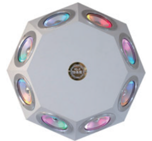
360度方向無指向性スピーカ